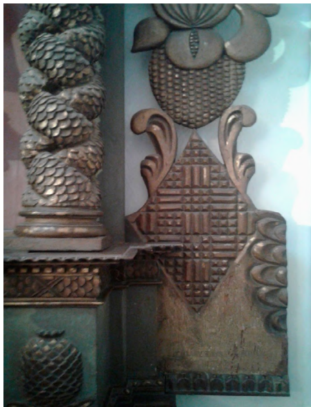
Imagen 3. Detalle figura romboidal lateral. Retablo S. XVII. Museo Histórico Provincial Marqués de Sobremonte.

espacio público. La verticalidad de las columnas remite al carácter “ascensorial” como huella reiterativa en la simbología andina y del noroeste argentino, que permite la asociación simbólica (visualmente construida) de conectar los estadios terrestres con los espirituales, por medio del movimiento ascendente representado en ideografías de ritmos escaleriformes. Es notoria la repetición de huellas que buscan generar la ilusión de movimiento, con columnas cargadas de detalles y elementos rítmicos, como los trenzados tallados con escamas de serpientes en tanto índices amerindios (Imagen 3).