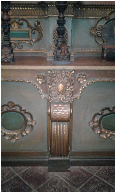
Imagen 2. Pilastra banco. Retablo S. XVII. Museo Histórico Provincial Marqués de Sobremonte.

prominente sobresale del conjunto, generando una mesa soporte de candelabros y esculturas, en una gramática necesaria para la asociación con la “mesa” de la última cena, fundamental para la conmemoración del rito de la Eucaristía. Flores, conchas marinas, escamas de pescados y volutas de agua forman parte de los elementos iconográficos dentro de la composición del banco retablar, asociando semánticamente este sector con el estado seminal de la vida.