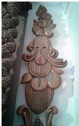
Imagen 4. Detalle frutales laterales. Retablo XVII. Museo Histórico Provincial Marqués de Sobremonte.

el “arriba” representativo y su sector inferior abstracto. Sin embargo, lo planimétrico del tratamiento del motivo frutal, su alto grado de iconicidad y su notoria geometrización dialoga coherentemente con el romboide. Estos dos relieves laterales idénticos, espejados entre sí, construyendo una simetría axial, son particularmente interesantes: el tratamiento de los frutales, especialmente el ananá, fruto cuyas escamaciones funcionan de forma repetitiva y modular, está presentado de forma plana sin ninguna descripción curvilínea que indique volumen. Este tipo de tratamiento es coherente con el tratamiento del relieve de las sociedades autóctonas andinas, paradigmáticamente de Tiwanaku, 19 donde la talla monolítica presenta incisiones superficiales y planas, como en el Monolito Ponce, el Monolito Bennett y la Puerta del Sol, entre otros. Recordemos que fueron los soportes textiles los que facilitaron la homogeneización regional visual –característica de los “horizontes” andinos–, 20 influenciados por sus técnicas de producción. Las técnicas y composiciones del telar se organizan a partir de la combinación infinita de módulos repetitivos con variaciones de color, textura, etc. Como marca, sus patrones geometrizaron en estilo y formas de producción las elaboraciones pictóricas y las tallas escultóricas (Paternosto, 1989); como huella específica, la leemos en esta sección particularmente modularizada del retablo.