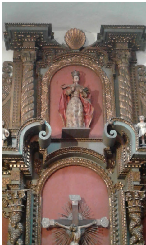
Imagen 5. Detalle sección superior. Retablo XVII. Museo Histórico Provincial Marqués de Sobremonte.

sinéctica y modularmente a otro ananá y después se encuentra la forma romboidal alegórica e iconográfica de textiles y tapetes amerindios. Para la cosmovisión andina, no hay una jerarquía entre humanos y el resto de los seres y elementos de la existencia; esta marca se convierte en huella en el retablo al presentar igualados en la sección central figuras humanas, serpientes, frutos y tapetes/textiles, incluso, según Arnold y Espejo (2013), los textiles son considerados sujetos vivos para las comunidades andinas amerindias.