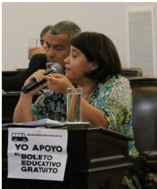
Ilustración 5 Legisladora Lucía Ávila en sesión, Cámara de Diputados

Una de las principales luchas sostenidas por la diputada, para la que ha presentado proyecto, es la de sancionar una ley antiminera provincial. Lucía manifiesta que será su bandera mientras se encuentre en este espacio de toma de decisión e incluso después, en caso de no lograrlo durante su gestión.