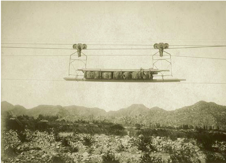
Ilustración 3 Vagonetas transportando pasto para las mulas de la obra