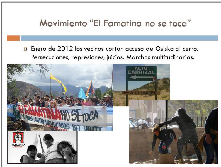
Ilustración 4 Conflicto en Famatina

Es claro que en la puja por disponer de un recurso natural se emplearon estrategias de coacción. Sin embargo, del otro lado se encontraba un fuerte sentido de pertenencia, de identidad, de significación, de empatía con el propio lugar así como de constitución de redes ciudadanas. Cuando la convicción, la proyección de desarrollo, los valores son compartidos difícilmente se logrará imponer una postura.