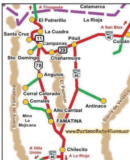
Ilustración 2 Región Famatina y Chilecito (Antinaco-Los Colorados)