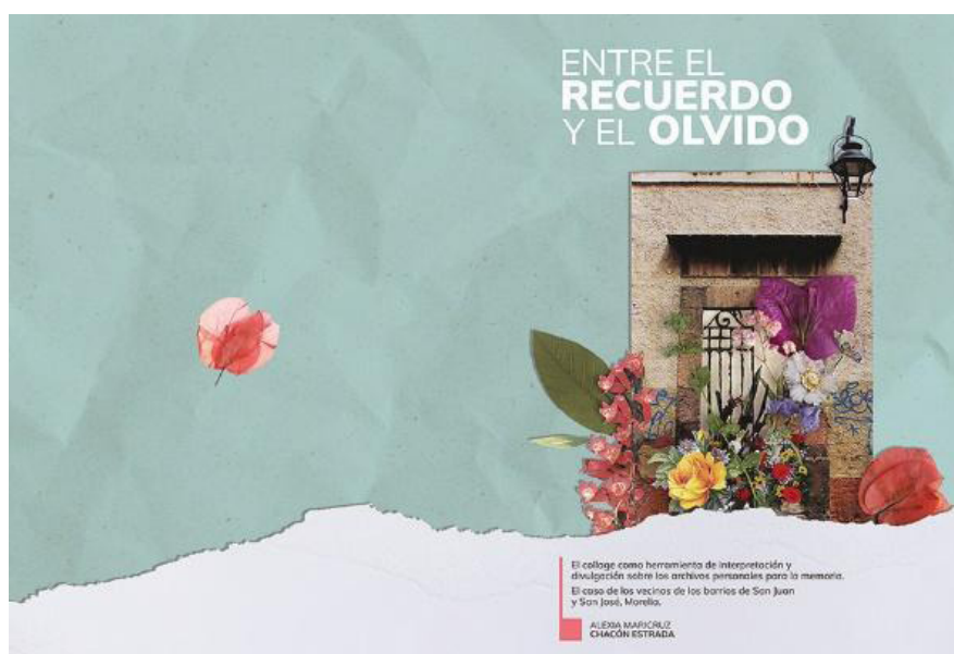
Imagen 5. Portada de tesis

Quisiera cerrar haciendo una invitación para todo aquel que quiera mirar lo que se está haciendo desde otras disciplinas interesadas en tener un acercamiento a los archivos, para ello pueden consultar la tesis completa en el repositorio de la UNAM. 10