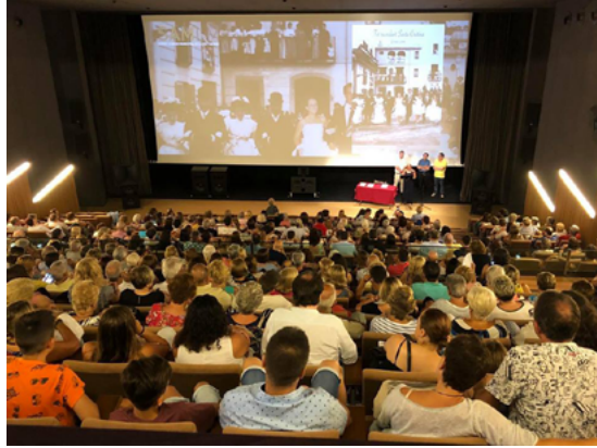
Imagen 4 Presentación del documental “Tot recordant Santa Cristina” . 20 de julio de 2018.

En definitiva, como se ha podido constatar, la función social de los archivos nos acerca a la ciudadanía, enriquece nuestro patrimonio con ingresos de fondos documentales, y contribuye a mejorar determinados aspectos de nuestra sociedad. Así pues, debemos ser capaces de impulsar este tipo de iniciativas porque nos debemos a la sociedad y la sociedad nos lo reclama.