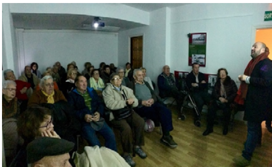
Imagen 1 Sesión de trabajo presencial del Grup d'Amics de l'Arxiu . Diciembre 2017.