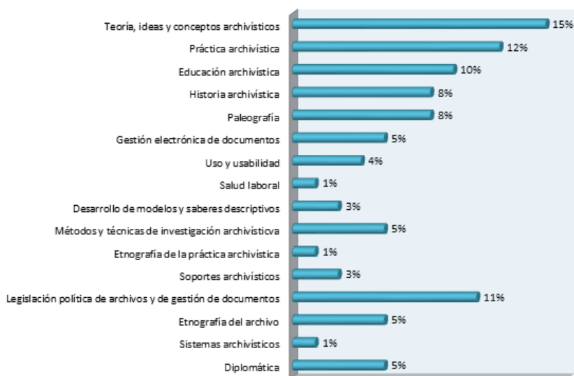
Gráfico 4: Temáticas de los artículos

Del gráfico 4 se desprende que los debates por la normalización de términos y conceptos y el alcance de los mismos, o la discusión de teorías exis-