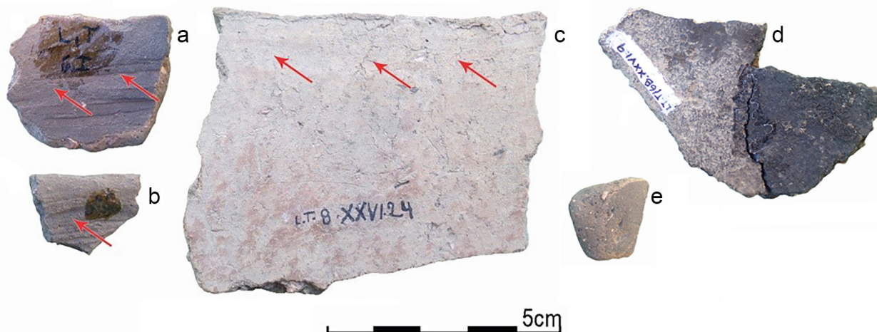
Figura 4. Fragmentos con huellas de emparejado, alisado, y alteraciones.