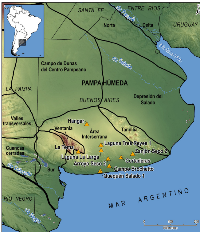
Figura 1. Ubicación de La Toma y otros sitios mencionados en el texto ubicados en el área Interserrana bonaerense.