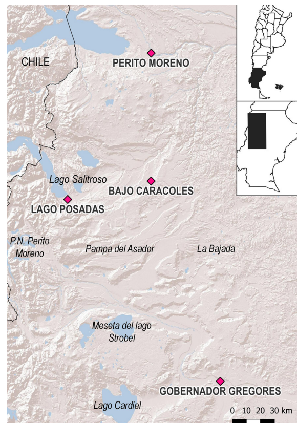
Figura 1. Ubicación de la región de estudio y de las localidades involucradas.

En términos de producción económica, tanto el Departamento Lago Buenos Aires como Río Chico han estado vinculados desde comienzos del siglo XX a la ganadería tradicional centrada en ovinos. Sin embargo, en los últimos treinta años se registró un prolongado estancamiento de tal actividad, como resultado del sobrepastoreo de los campos, la evolución negativa de precios (que alcanzó sus valores más bajos durante la década de 1990), la falta de nuevas inversiones, la desertificación y diversas contingencias climáticas y naturales, que impactaron negativamente sobre el sector (Aranciaga, 2013; Vacca y Schinelli, 2005). Esto propició la búsqueda de alternativas como la producción agropecuaria intensiva, el cultivo de forrajes y el establecimiento de chacras e invernaderos hortícolas. Asimismo, desde el año 2000, la región comenzó a ser objeto de explotación minera, particularmente de metales preciosos. De tal manera, diversas empresas de origen nacional y extranjero se instalaron en la región (Goldcorp/ Newmont, Patagonia Gold y Pan American en Perito Moreno y Triton en Gobernador Gregores). A partir del desarrollo de estos emprendimientos y de la pavimentación de diferentes tramos de la RN 40, las comunidades locales experimentaron grandes transformaciones. Paralelamente a este proceso, y en especial en las últimas dos décadas,