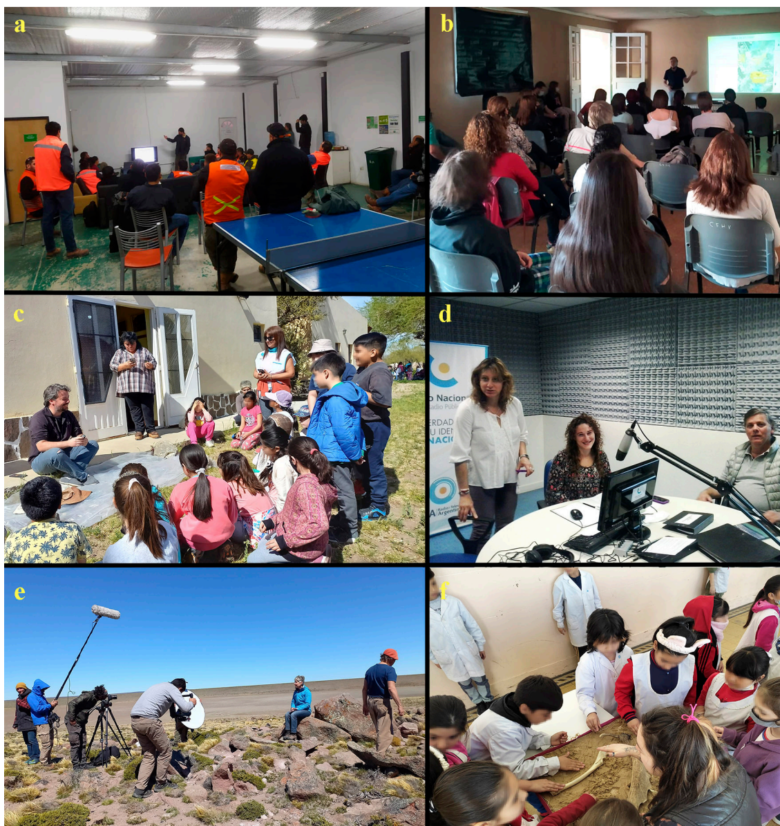
Figura 2. Actividades de CPC realizadas en distintos lugares. a) Charla con trabajadores de empresa minera (ámbito rural), b) Charla dirigida al público general (Lago Posadas), c) Taller de talla lítica con alumnos de escuela primaria y referentes locales (Gobernador Gregores), d) Entrevista en la radio (Gobernador Gregores), e) Filmación de la serie documental "Diálogos en el Tiempo", f) Taller "Detectives del Pasado", Escuela N°11 DE 6 (AMBA).