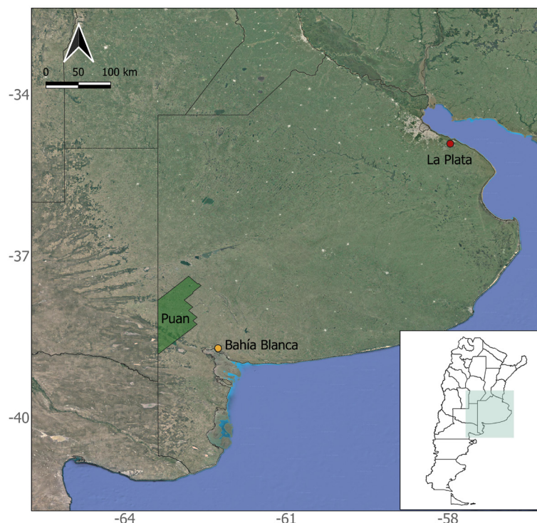
Figure 1. Location of the municipality of Puan in the Buenos Aires province.

encuentra poblado por 16.381 personas, siendo la principal actividad económica la agricultura y ganadería.