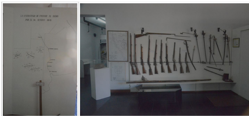
Figura 2. Mapa “La estrategia de frenar al indio por el Dr. Alsina 1876” (izquierda). Herramientas y armas exhibidas en la sala de ingreso al Museo Ignacio Balvidares de Puan (derecha).