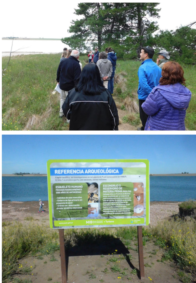
Figura 3. Relevamientos realizados durante la visita a la isla de Puan en el marco de la capacitación en arqueología (arriba). Cartelería elaborada para el Sitio 1 de la Isla de Puan por el MIB y el equipo de investigación (abajo).