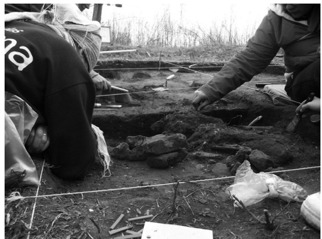
Figura 2. Excavaciones arqueológicas en el Fortín La Parva, General Alvear, Provincia de Buenos Aires.

Figure 1. Teachers and students visit to the archaeological site Fortin La Parva, General Alvear.