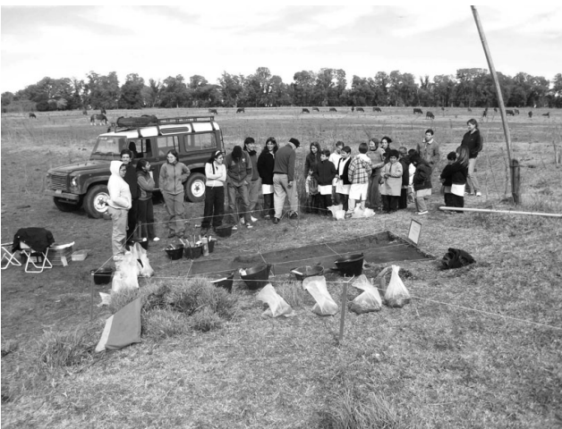
Figura 1. Visita de docentes y alumnos al Fortín La Parva, General Alvear.

Figure 1. Teachers and students visit to the archaeological site Fortin La Parva, General Alvear.