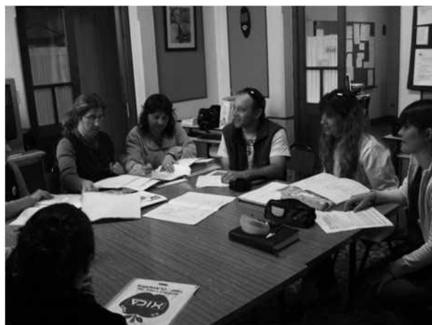
Figura 4. Elaboración, en conjunto con los docentes de lo ISFD N° 22 de Olavarría y el ISFDyT de General Alvear, de las Fichas Móviles Didácticas.