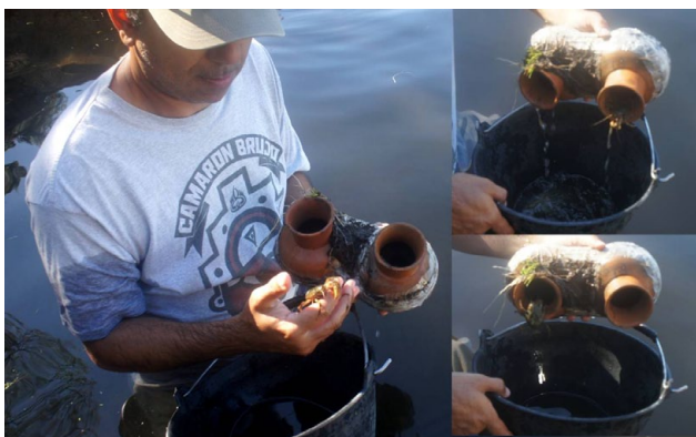
Figura 2. Extracción de paquetes de vasijas experimentales para el registro y conteo de los especímenes capturados.

Figure 2. Experimental vessels packages recovery for recording and counting of captured specimens.