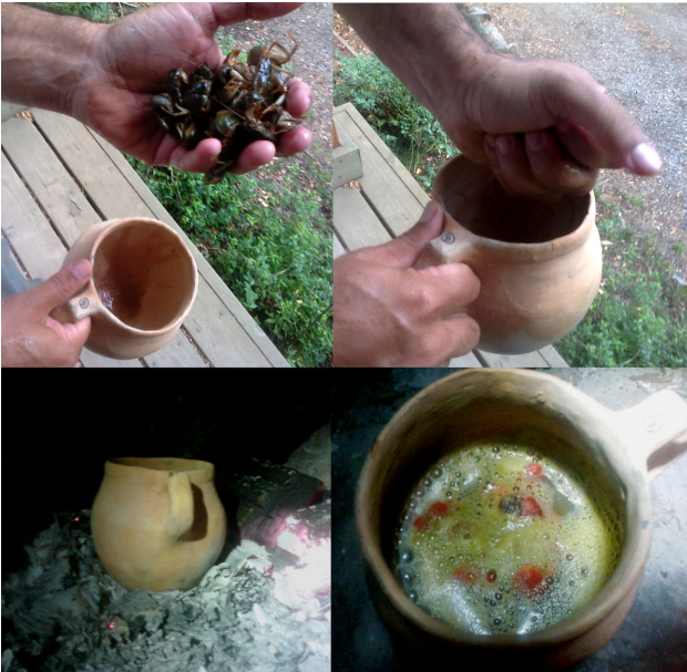
Figura 3. Cocción de crustáceos en una pieza cerámica experimental.