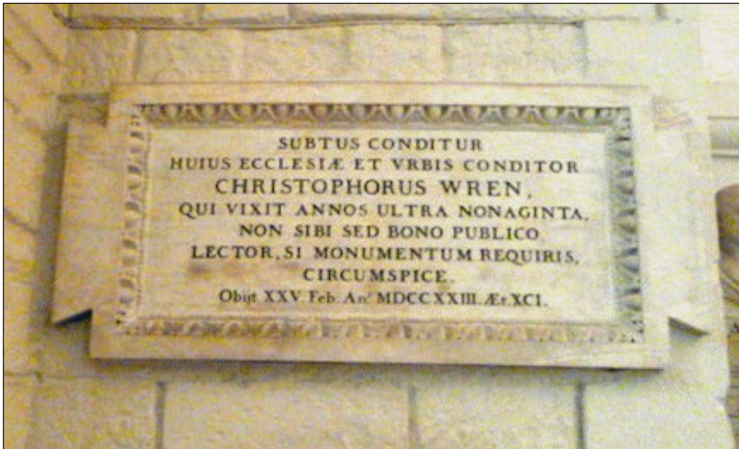
Figura 3: Inscripción en la tumba de Christopher Wren.

En su lápida podemos leer: "Si quieres ver su monumento, mira a tu alrededor" (Figura 3).