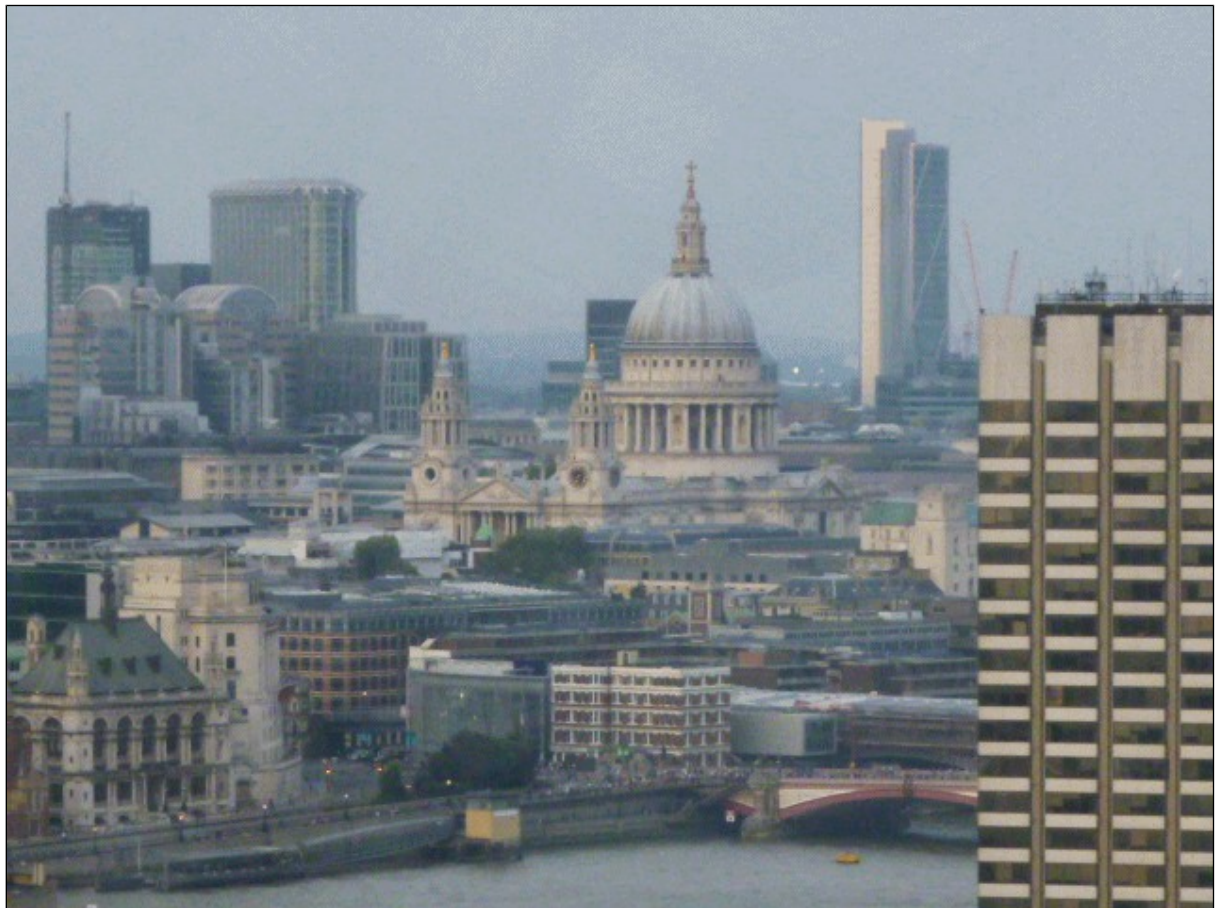
Figura 2: Catedral de Saint Paul.

El gran incendio de Londres, en 1666, le dio la oportunidad de presentar un proyecto de reconstrucción de las iglesias de la ciudad y en 1669 fue nombrado Inspector General de las obras del Rey reconstrucción de la ciudad, por parte de Carlos II. Su plan urbanístico no se realizó, pero tuvo a su cargo la reconstrucción de más de 50 iglesias, entre las cuales la más emblemática es la de Saint Paul, cuyo domo aún hoy sobresale en la silueta de Londres (Figura 2). Construyó además varios edificios civiles, entre ellos dos hospitales en Chelsea y Greenwich.