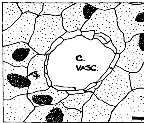
Fig. 2: Sección transversal de raicillas noduladas de A. aff. cordobensis mostrando células infectadas conteniendo esporangios (Sp) del género Frankia . Escala: 10 micras.

durante la diferenciación de los esporangios. Dado esta característica, las estructuras mencionadas no han sido observadas en los cortes de nódulos realizados.