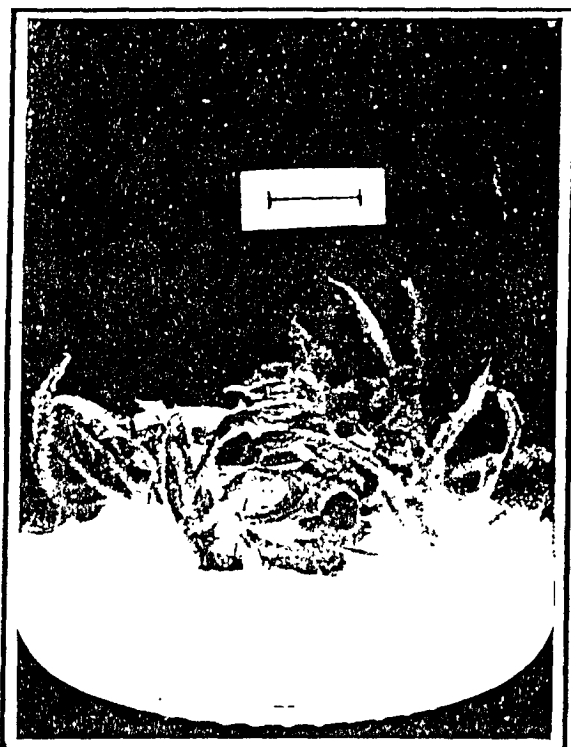
Figura 2: Brote crecido en medio St después de 30 días de cultivo.

logra el crecimiento normal de las yemas, con un adecuado alargamiento de los entrenudos, posiblemente debido a la presencia de la giberelina. Por ello, tanto con auxinas (medio D) como sin este regulador (medio A), un número similar de brotes de un tamaño apropiado para proseguir con la micropropagación pudieron ser transferidos al medio de multiplicación.