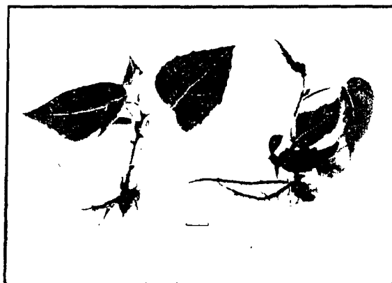
Figura 3: Plantitas de kiwi crecidas "in vitro" en medio MSIZ.

El empleo del medio para el enraizamiento de los brotes que utiliza este autor (medio St), sin auxinas ni sacarosa, significó la pérdida del material, sin que se formaran raíces. El agregado de sacarosa (medio StA) y de ésta y riboflavina (StR) aunque mejoró la calidad de los brotes, sólo provocó la formación esporádica de