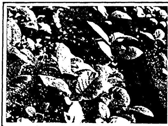
Figura 4: Plantas de kiwi rusticadas en terrinas listas para ser transplantadas a macetas.

Cuando para el enraizamiento de los brotes, al medio StA se le agregó IBA (medios StI y StI10) se logró la iniciación de raíces en un cierto número de ellos (Tabla 2). Sin embargo, no pudo evitarse la formación de callo basal, que fue mayor en la concentración más alta de IBA. Las raíces formadas eran escasas, sin que en las primarias se originaran raíces secundarias. Como esas raíces se formaban, mayormente, en el callo basal, se perdían en el traspaso a las macetas, lo que significaba la muerte de las plantitas. El agregado de PPZ mejoró tanto el enraizamiento como la calidad de las raíces (ver Tabla 2), alcanzándose valores del 75% de brotes enraizados.