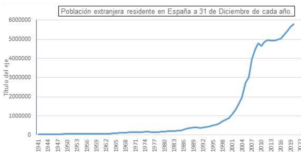
Figura 1, Población extranjera residente (total) 1940-2022

Fuente: Instituto Nacional de Estadística (INE), Ministerio del Interior, Dirección General de Seguridad, Dirección General de la Policía, Ministerio de Inclusión Seguridad Social y Migraciones.