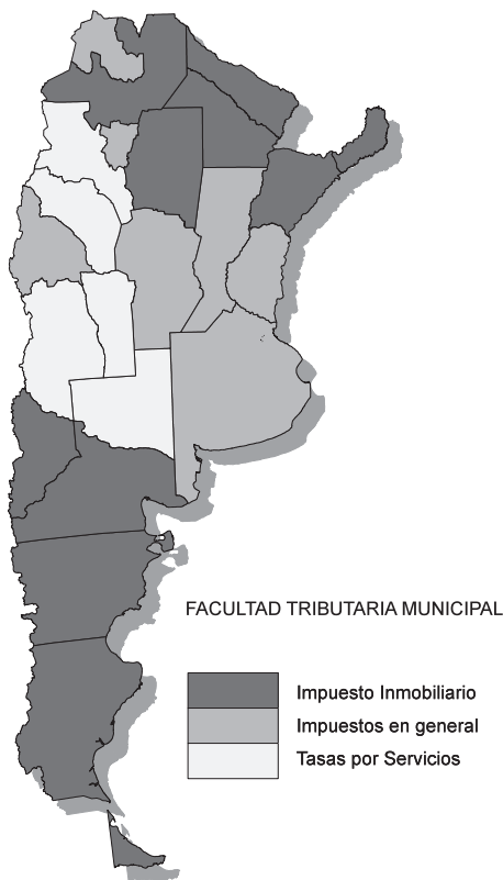
Fuente: Constituciones Provinciales y Leyes Orgánicas Municipales Vigentes

En resumen, la débil participación cuantitativa de los municipios en el esfuerzo fiscal realizado, refleja a la vez una diversidad de situaciones, a veces ambiguas y confusas. No sólo se presentan diferentes categorías jurídicas y territoriales de municipios, sino también diferentes grados de autonomía, variedad de facultades tributarias y competencias normativas municipales, así como ejercicio de las mismas. Las situaciones van desde provincias que han facultado plena y exclusivamente a sus municipios para