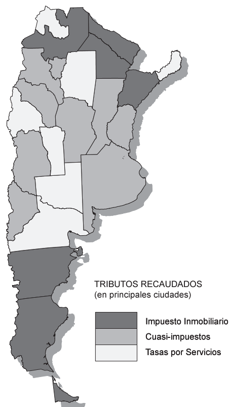
Fuente: Códigos Tributarios, Ordenanzas Fiscales, Impositivas y Tarifarias vigentes de las principales ciudades.