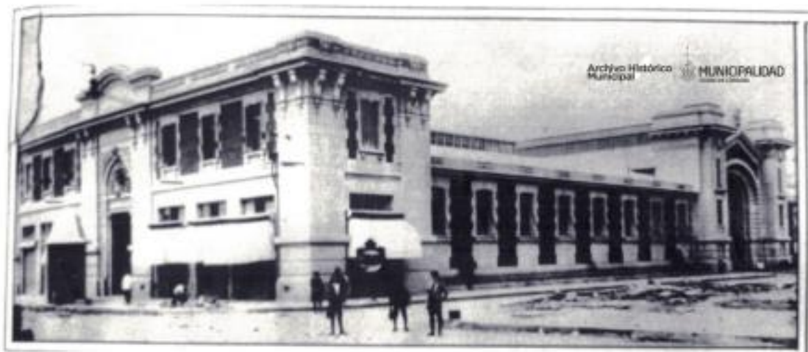
Figura 1. Mercado Norte antes de su inauguración

Fuente: Archivo Histórico Municipal de Córdoba. Imagen 2611. Mercado Norte - Arq. Salvador Godoy y José Hortal. Año 1926.