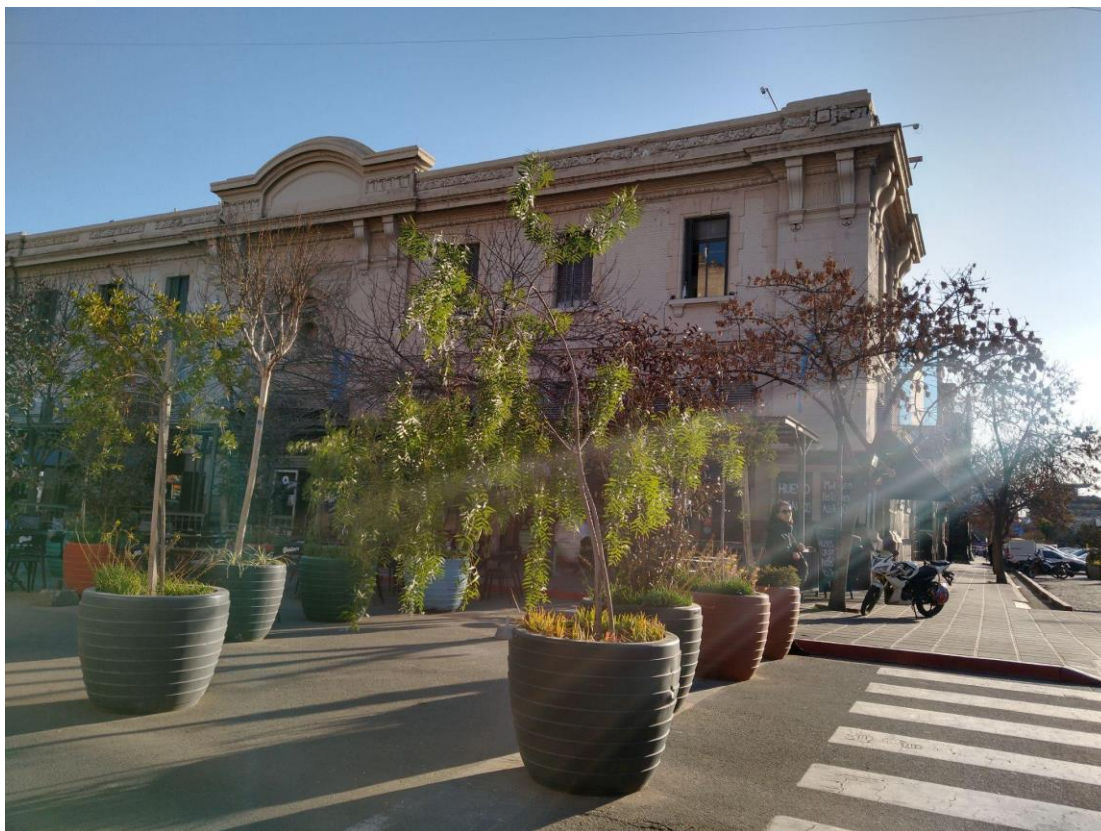
Figura 6. Canteros sobre calle Rivadavia.

Fecha: 7/07/22