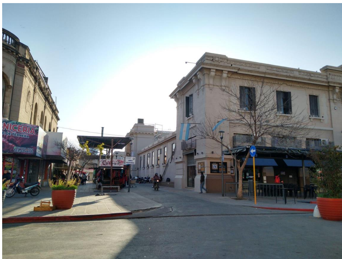
Figura 5. Fachada del Mercado Norte. Esquina de Rivadavia y Catamarca

Fecha: 7/07/22