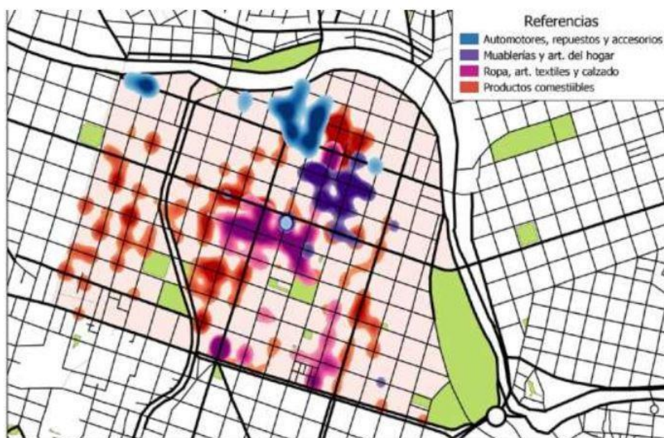
Figura 4. Concentración de comercios minoristas por grandes rubros.