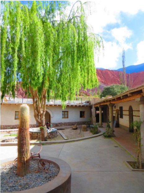
Fig.6. Nueva configuración funcional de las viviendas, transformadas en alojamiento para turistas.