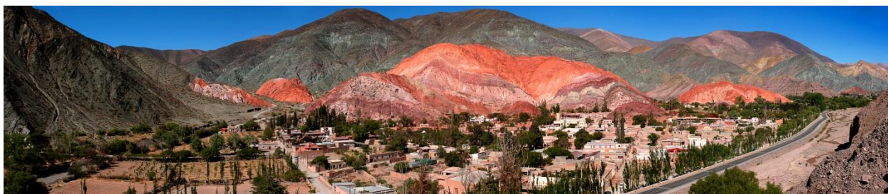
Fig.1. Cerro de los Siete Colores. Muestra la magnificencia del paisaje de Purmamarca.

cultura acervada por costumbres nativas, religiosas y colonialistas 6 . Con un clima caracterizado como desierto templado con temperaturas medias son entre 12°C y 14°C y gran amplitud térmica durante el día y la noche, amplitudes entre 13°C a 18°C entre temperaturas máximas y mínimas. Las lluvias anuales son menores a 200mm. La localidad forma parte del angosto y profundo Rio Grande, que conforma la reconocida Quebrada de Humahuaca. Su acceso desde San Salvador de Jujuy, es por la ruta Nacional N° 9, a 65Km, y a 3Km por la ruta Nacional 52, a su vez por esta puede accederse desde el Paso de Jama – Chile (Fig.2). Ambas rutas a partir de los `90 se convirtieron en rutas comerciales por su vinculación con fronteras y salidas al mar de países como Chile, Brasil, Bolivia y Paraguay. Al que se denominó eje de capricornio, por ubicarse en torno al trópico del mismo nombre y por conformar las salidas al océano Pacífico y Atlántico respectivamente. De esta manera la localidad en conjunto con la Quebrada de Humahuaca y la región iniciaron un paulatino proceso de transformaciones territoriales, sociales y económicas entre 1990 a 2010, que fue acelerado por su declaración de la UNESCO como Patrimonio de la Humanidad (2003).