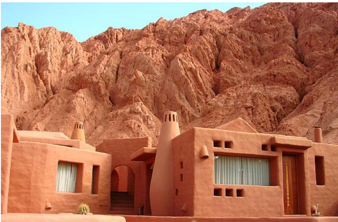
Fig.10. Re-interpretación de la arquitectura vernacular, la relación simbiótica con el paisaje, y revalorización del sistema constructivo de adobe y paja.