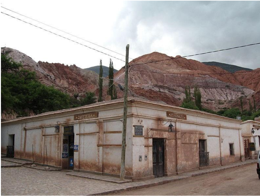
Fig.8. Vivienda con locales habitaciones comerciales, con sistema constructivo vernacular.