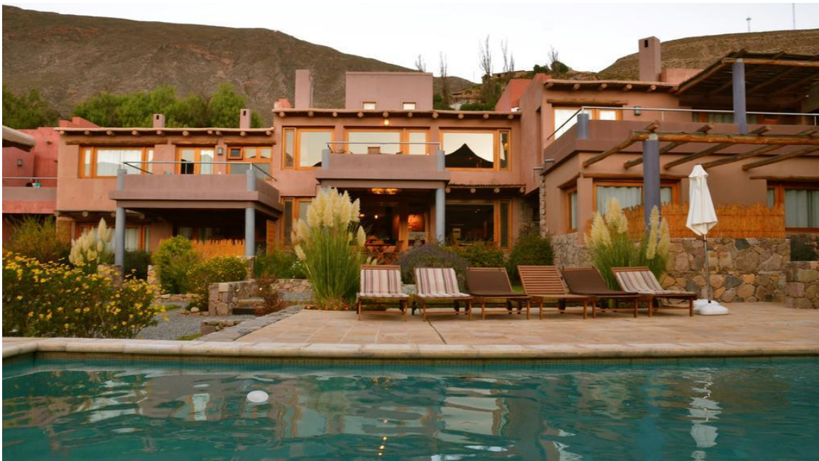
Fig.9. Nueva configuración edilicia en la imagen de los emprendimientos turísticos.