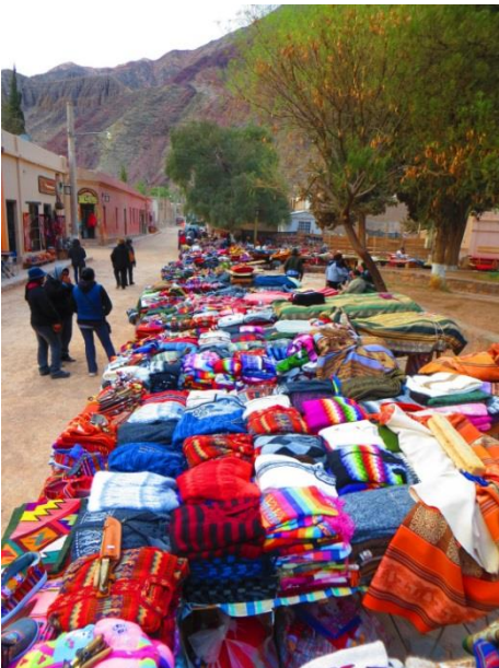
Fig.7. Nuevos sectores peatonales y recorridos turísticos vinculados a calles principales proponen además la venta de artículos regionales.