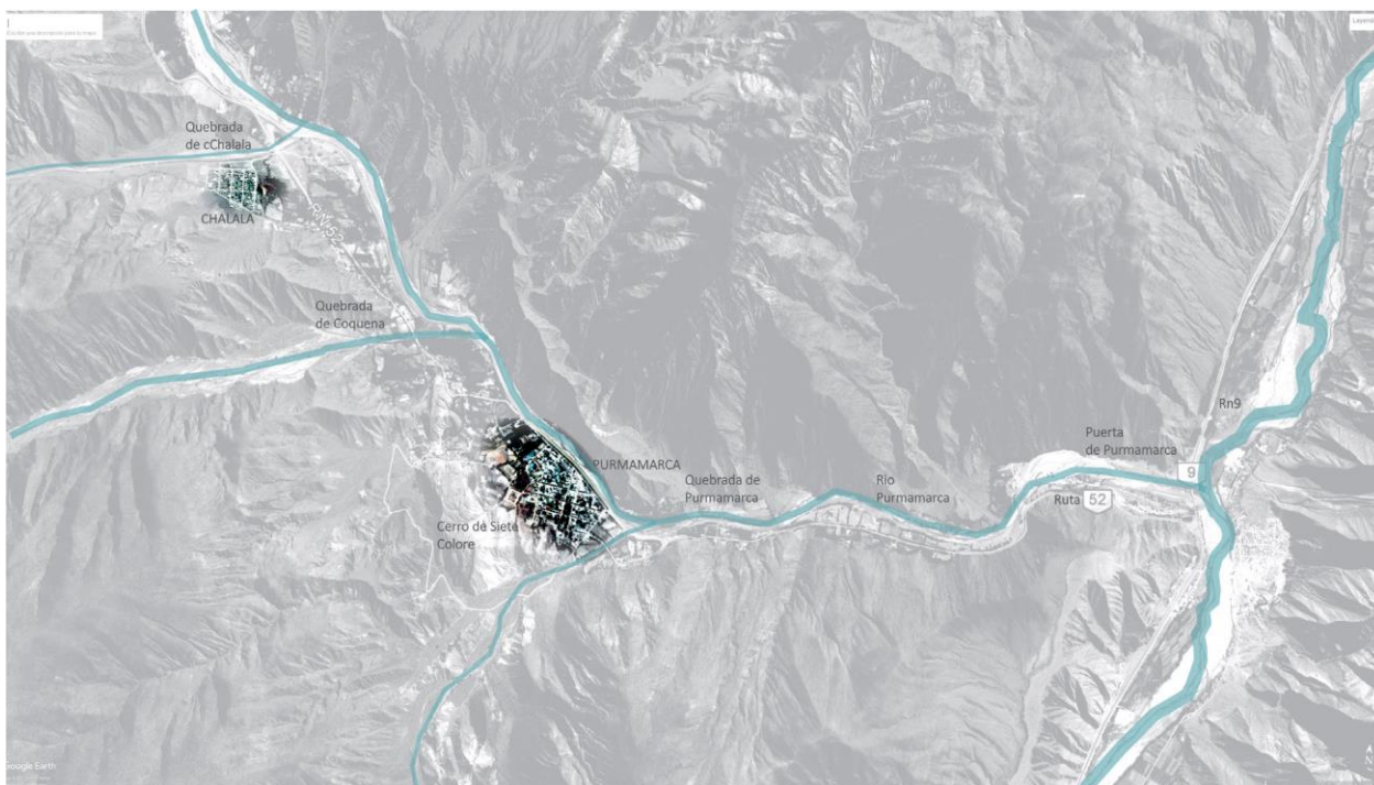
Fig.3. Extensión del poblado por expulsiones del proceso de turistificación, los barrios se denominan Chalala y El Coquena.