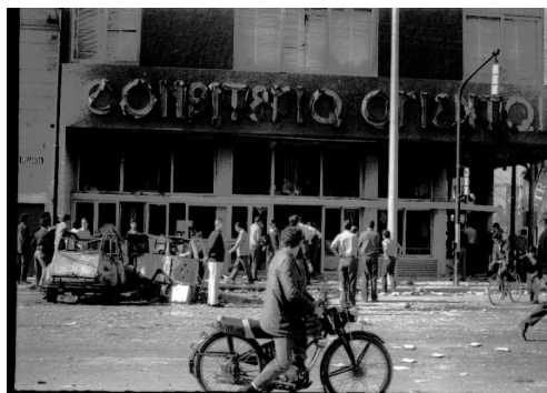
Quema de la Confitería Oriental ubicada en Barrio Alberdi

Fotos inéditas de Gloria de Villafañe Lastra