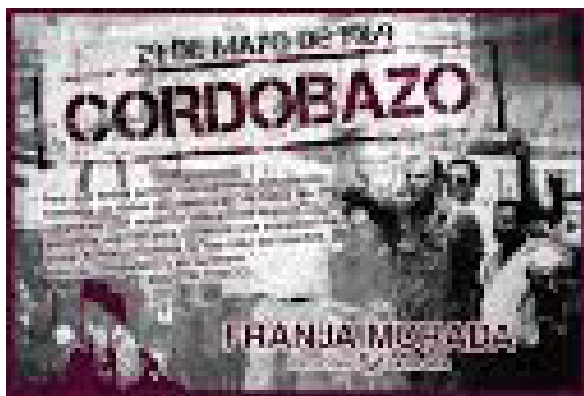
Afiche de Franja Morada sobre el Cordobazo

El Cordobazo le costó la renuncia del gobernador el 16 de junio y lo interesante de destacar es que entre esa fecha y marzo de 1971 Córdoba tuvo la presencia de cinco gobernadores, 3 militares y dos civiles.