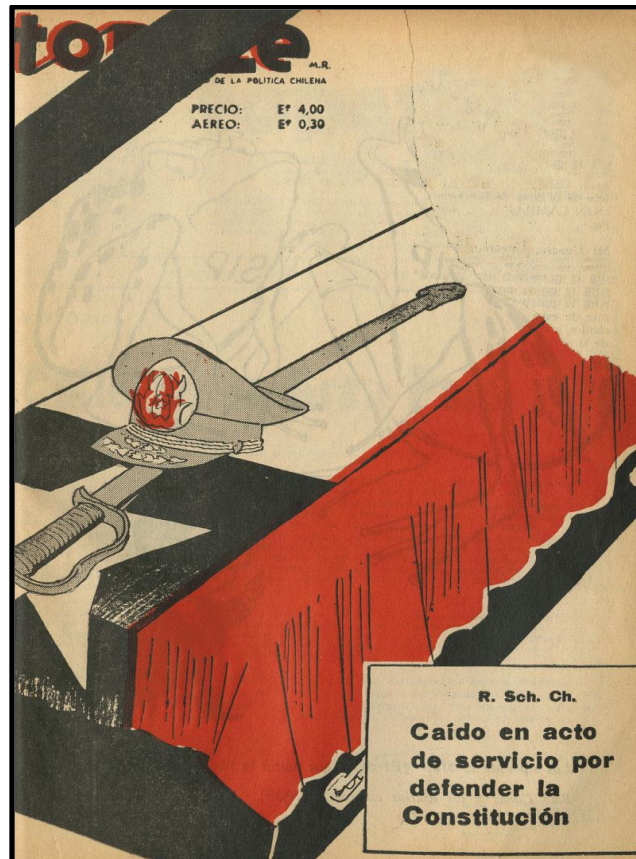
Fig. 1: Topaze , n° 1981, Santiago, 30 de octubre de 1970.

En síntesis, durante la década de 1960 Topaze vivió un momento de inestabilidad y tendió a dejarse influir por algunas corrientes partidistas, o por lo menos así se denunció. En el último número, del 30 de octubre de 1970, hizo una crítica explícita hacia los posibles asesinos del general René Schneider y el rol de este como defensor del orden constitucional 6 : “caído en acto de servicio por defender la constitución” (Fig. 1). Este último número fue prácticamente dibujado sólo por Melitón Herrera (“Click”), lo que da cuenta de la precariedad que había alcanzado la otrora revista de humor político gráfico más longeva e importante de la historia de Chile al tener sólo un dibujante realizando todo el trabajo de un número.