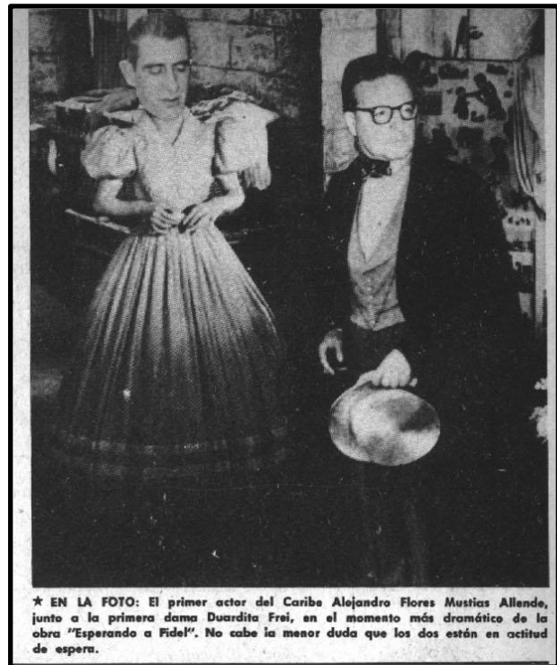
Fig. 5, Topaze , 07 de agosto de 1959

Por otro lado, las sospechas del apoyo soviético al gobierno cubano no se hicieron esperar y de manera más metafórica o más directa se representó la posible injerencia que el gobierno soviético tuvo en la consolidación del triunfo de la Revolución Cubana. Por ejemplo, la ilustración de Lugoze muestra a Fidel Castro bailando al estilo ruso, pero con traje de “rumba” y detrás lo mira el Tío Sam diciendo: “Cada día me parece más curiosa la rumba que baila este señor” (Fig. 6).