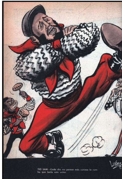
Fig. 6. Lugoze, Topaze , 24 de julio de 1959.

La figura de Fidel Castro comenzó a tomar una notoriedad cada vez más amplia en las revistas de humor político. La consolidación y asentamiento de la Revolución Cubana empoderó el rol que jugó su opinión en el contexto interamericano, lo que propició la visita del presidente estadounidense a Sudamérica en 1960. Las figuras de Castro y Ernesto “Che” Guevara, serían banderas de lucha levantadas en los diversos países de Latinoamérica y Chile no fue la excepción. El segundo momento en que Cuba tomó los principales medios de comunicación fue en el marco de la Crisis de los Misiles en 1962.