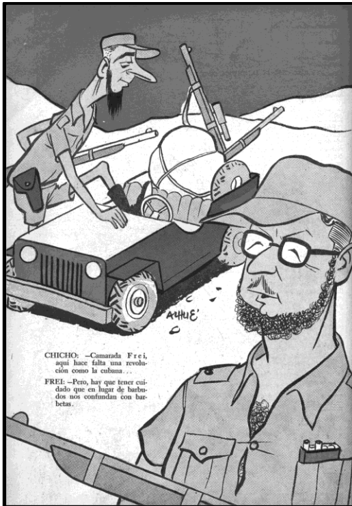
Fig. 4, Alhué, Topaze , 06 de marzo de 1959