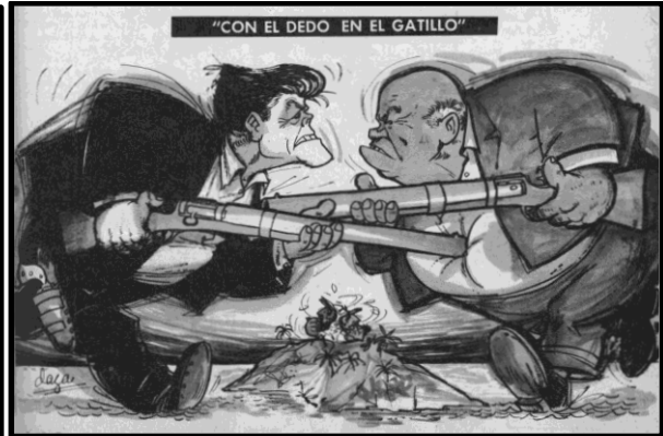
Fig.10. F. Daza, Topaze , 26 de oct. 1962.

La Crisis de los Misiles fue uno de los momentos más retratados de los conflictos de la Guerra Fría en Topaze . El semanario se hizo cargo de presentar explícitamente este incordio prácticamente día por día. Algo interesante es la visión que se presentaba del fin de la crisis, puesto que se tendía a plasmar que Jruschov y el gobierno soviético habían abandonado a Fidel Castro y el gobierno revolucionario de la isla. Ejemplo de esto son las la Fig. 11 y 12. La fig. 11 por un lado, presenta una acción en cuatro cuadros. En la primera se muestra a un pequeño Fidel Castro sobre un bloque que dice “bases rusas” que levanta su puño –al parecer– contra unas piernas que simbolizan al presidente de Estados Unidos. En el segundo cuadro, mantiene su actitud, pero se ven unas manos enlazadas. En el tercer cuadro ambas piernas se retiran y se ve como el pequeño Fidel se va cayendo. Finalmente, en el último cuadro se expresa a Fidel triste y solo, incluso con su habano en el piso. Así, la historieta simboliza que Cuba ha perdido el apoyo estratégico del gobierno soviético. La Fig. 12, “regreso a casa”, muestra a Jruschov y Kennedy alejándose abrazados de Cuba, cada uno cargando sus armas, mientras tanto a la espalda de ambos se presenta a un Fidel Castro semidesnudo con cara de lamento sentado sobre la isla de Cuba.