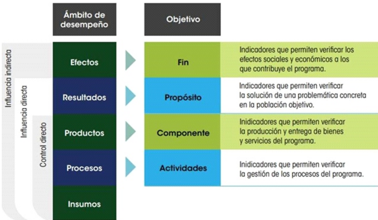
Figura 3 Consejo Nacional de Evaluación de la Política de Desarrollo Social (CONEVAL) de México