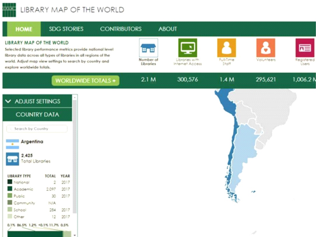
Figura 1: Mapa de IFLA de las Bibliotecas del Mundo.

La Red de Redes de Información (RECIARIA), que agrupa 37 redes con 2.423 bibliotecas y una red de asociaciones, continúa trabajando en el Mapa de redes de la Argentina como una forma de cooperación bibliotecaria ya que permitirá como objetivo final que: