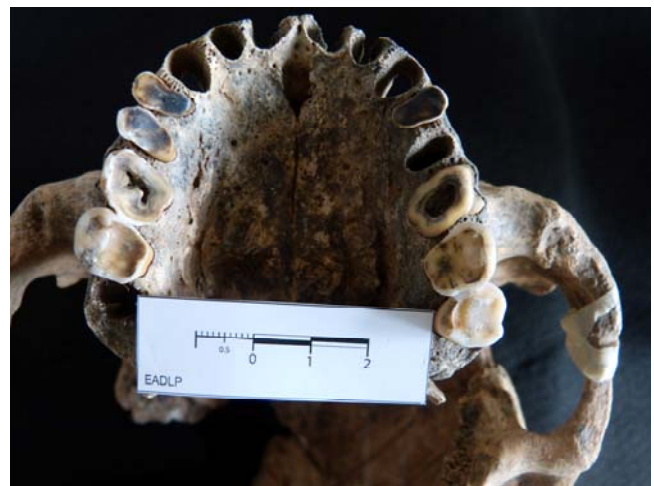
Figura 3. Arcada dental superior de un individuo de Pavenham, en el cual se puede observar claramente el fuerte desgaste presente en premolares y molares.