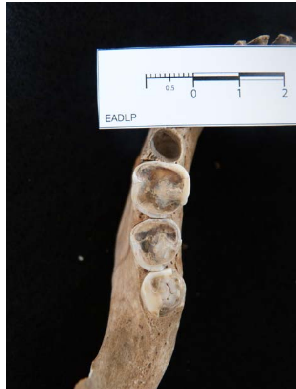
Figura 2. Fragmento correspondiente a una hemi-mandíbula izquierda, recuperada en el sitio Pavenham, en la cual se puede observar el desgaste presente en primeros, segundos y terceros molares inferiores.

grado de desgaste de las piezas dentales en poblaciones con sistemas de subsistencia de tipo cazador-recolector y agrícola.