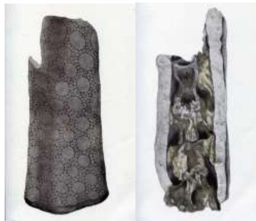
Fig. 6: Porción proximal y vista interior de un tubo caudal de su “ Dasyopus Megatherium Cuv. ” (Larrañaga, 1930, Láms. XII y XIII), actualmente correspondiente a un gliptodonte, según Méndez Alzola (1950).

Sin embargo, el dibujo en que ilustra un Megatherium en el Atlas que acompaña a sus escritos es una copia de la ilustración recibida de su amigo y maestro Bartolomé Muñoz correspondiente al Megatherium americanum del río Luján (véase Méndez Alzola, 1950, Lám XII; Ramírez Rozzi y Podgorny, 2001). Respetando el dibujo original le puso color y logró una reconstrucción artística más real (Fig. 6).