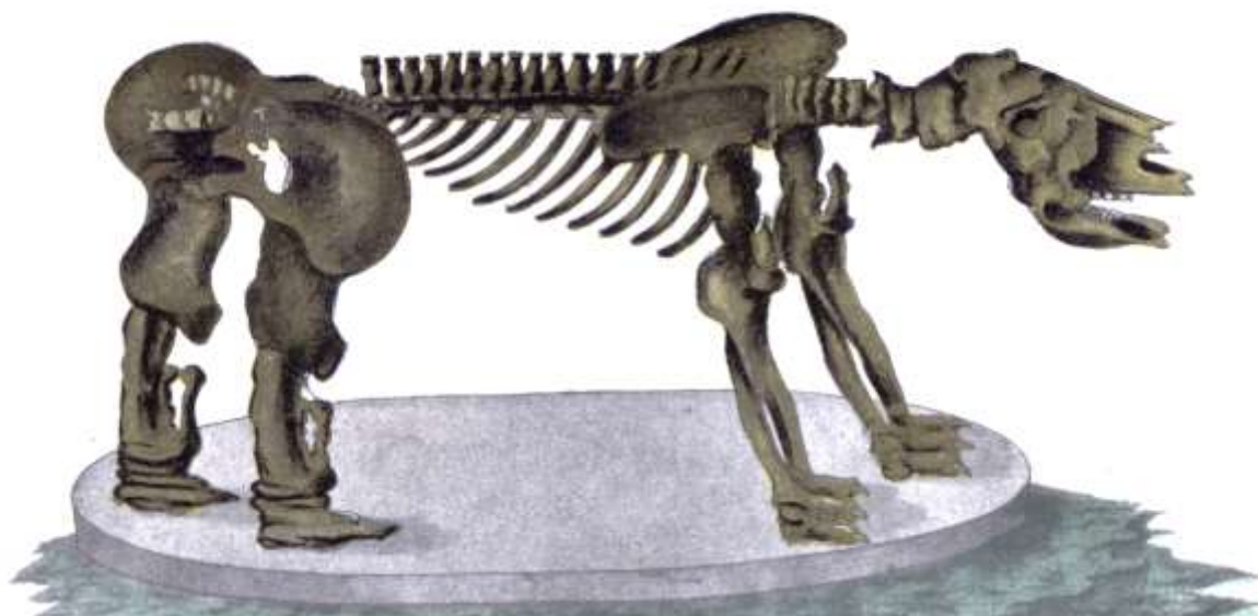
Fig. 7: Ilustración del Megatherium que figura en sus Escritos (Lám. XIX, Larrañaga, 1930). El ejemplar ilustrado es procedente del río Luján. Compárese con la copia recibida de Bartolomé Muñoz ilustrada por Méndez Alzola (1950, Lám. XII) o por figura 1 de Ramírez Rozza y Podgorni (2001).

anuncia que el Megatherium habría tomado su analogía con los tatús, hasta ser como ellos revestido de corazas escamosas. Debemos esperar con impaciencia la memoria importante que esta carta promete" (Trad. de Méndez Alzola, 1950, pág. 62-63). Cualesquiera que sean las razones que motivaron la asignación subgenérica de Larrañaga que implicaba la existencia de megatéridos acorazados como " Dasyopus (Megatherium Cuv.) ", el hecho que su opinión apareciera en un trabajo de Cuvier aseguró su credibilidad (Fericola et al., 2009), de modo que varios restos incompletos que luego llegaron a Europa fueron igualmente reconocidos como tales (p. ej., Weiss, 1830; Clift, 1835).