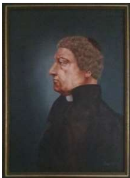
Fig. 2: Dámaso Antonio Larrañaga (1771-1848), retrato de 1947 existente en el tesoro de la Biblioteca Nacional en Buenos Aires.