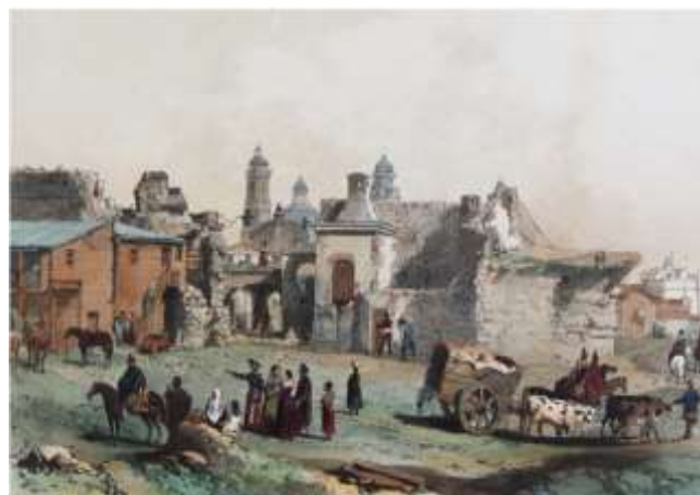
Fig. 3: Mercado en Montevideo y la Catedral al fondo en tiempos de Larrañaga durante la primera mitad del siglo XIX (Adolphe D'Hastrel, Museo Nacional de Artes Visuales, Montevideo).

Dos años después se reúne en el congreso de las Tres Cruces, en el campamento de Artigas, para elegir los delegados a la Asamblea Constituyente del Año XIII, siendo propuesto Larrañaga para encabezar la delegación. Las históricas Instrucciones de Artigas para presentar a la Asamblea según algunos autores fueron escritas por el mismo Larrañaga. La Asamblea rechaza la acreditación de los diputados orientales, después de largas tratativas.