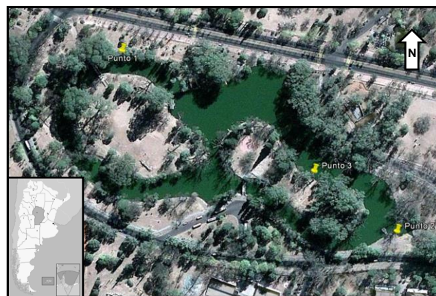
Fig. 1. Ubicación del área de estudio, los marcadores indican donde se tomaron las muestras.

La recolección de muestras se realizó estacionalmente durante el periodo comprendido entre marzo de 2011 y diciembre de 2016, en tres puntos perimetrales al lago. Durante los años 2015 y 2016 se realizaron limpiezas, por lo que se efectuaron muestreos antes y después de las mismas.