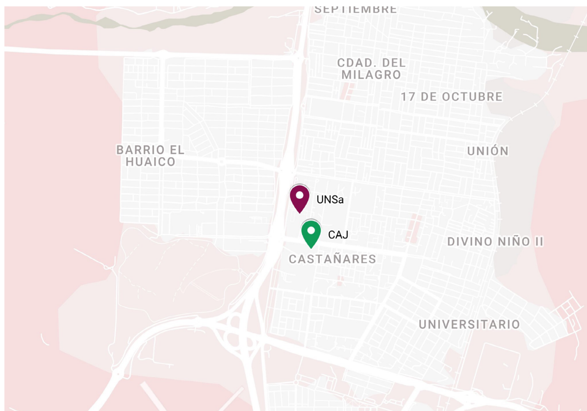
Figura N°1. Mapa de la Ciudad de Salta con referencias (UNSa y CAJ)

Los talleres buscan ejercer una “fuerza centrípeta” entre la Universidad Nacional de Salta y diferentes instituciones, actores y grupos sociales; es decir, una fuerza que los “invite” a nuestra institución y a que ella, a través de sus miembros, pueda “aparecer” en sus cartografías. De esta manera nos incumbe la posibilidad de generar lazos entre la universidad y un dispositivo de privación de la libertad, tender puentes entre dos instituciones que se encuentran próximas en términos de distancia física (o más precisamente, tan solo al cruzar una avenida) aunque se perciba una gran distancia social.