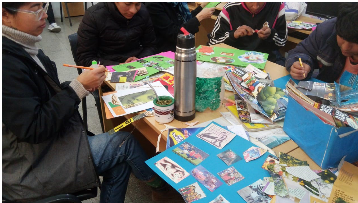
Figura N°4. Taller de expresión con papeles y telas. Julio de 2024.

imparte conocimiento. En algunas oportunidades esta dinámica parece desconcertar a los jóvenes quienes preguntan y repreguntan indicaciones precisas sobre cómo proceder con sus producciones. En otros casos la dinámica desemboca en intervenciones del personal del CAJ (siempre observándonos) que van desde acciones para “ayudar” a los jóvenes en su quehacer (cortar una imagen, hacer letras, dibujar) hasta llamados al orden y sanciones.