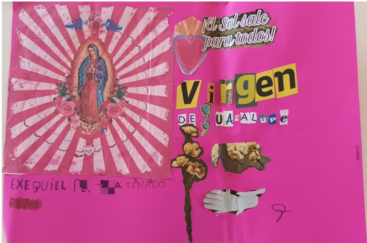
Figura N°2. Producción de Exequiel realizada en 2024 (con pixelado para preservar sus datos personales)

Resulta sugerente reflexionar acerca de aquello que sucede en los encuentros cuando los jóvenes entran en contacto con materiales, los exploran y dan curso a sus producciones. Retomamos los aportes de la investigación de Rubiar Medina (2019) acerca de la percepción háptica (a través del tacto) y de su rol en los procesos de aprendizaje, para repensar cómo en la exploración táctil de la materialidad y los objetos, lxs niñxs construyen un repertorio que vincula la experiencia sensorial con el entorno material y social que los rodea.