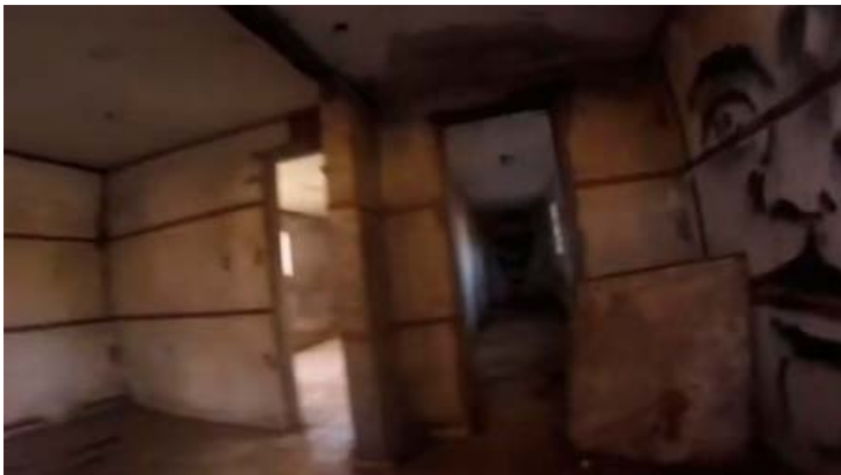
Figura n°2: aula-taller. Parte interior del edificio luego de su recuperación.