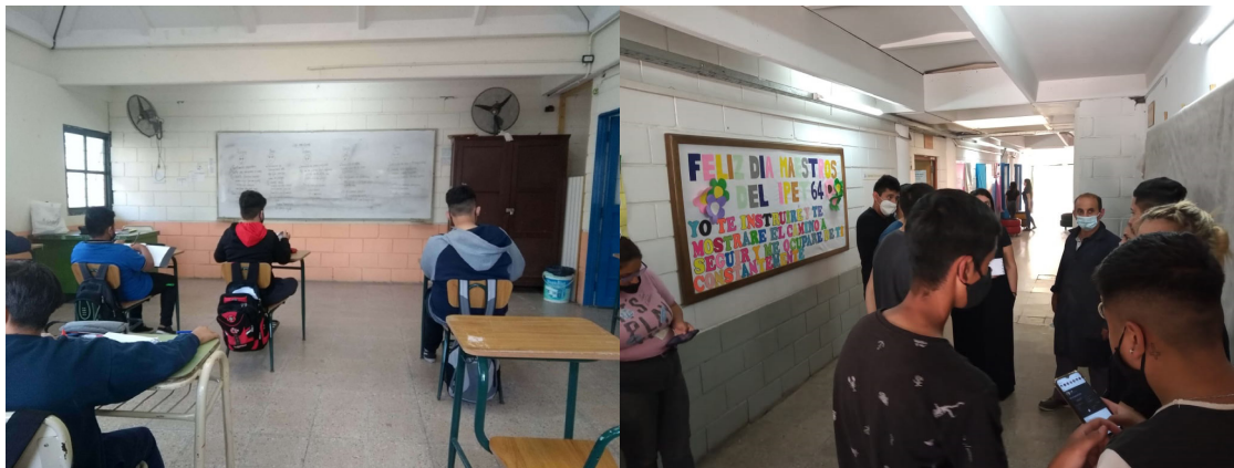
Figura n° 1. Volver a la presencialidad: entre barbijos y distanciamiento.

Fotografías tomadas por el equipo extensionista, con la autorización de los jóvenes.