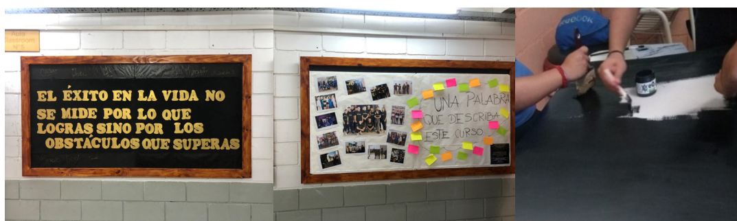
Figura n°3. Construcción de bastidores y producción colectiva entre estudiantes. Fotografías tomadas por el equipo extensionista, con la autorización de los jóvenes.