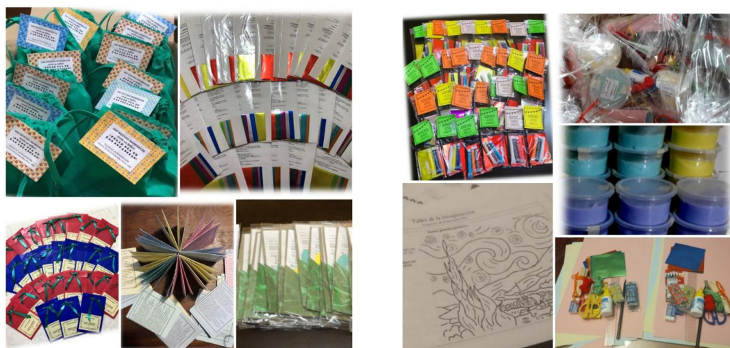
Figura N° 5 y 6 “Kits para jugar e imaginar”

Los Kits para jugar e imaginar son diseñados desde el equipo y compartidos con las profesionales del Centro de Salud, quienes recorren cada semana, casa por casa, para hacer llegar las actividades e insumos. Son creaciones artesanales que incluyen artículos de librería, alimentos para meriendas y desayunos, al tiempo que les acercamos propuestas socioeducativas: estéticas, artísticas, literarias y lúdicas, pensadas para jugar, escribir, plegar papeles, recortar, amasar plastilinas, entre otras. También contienen textos literarios que invitan a imaginar y crear los propios. Se trata de actividades que implican experiencias con la naturaleza, por ejemplo, con la luz del sol, ramas secas, piedras, hojas, tierra y el propio cuerpo. Siempre con recursos que proveemos o que imaginamos puedan ser fáciles de obtener.