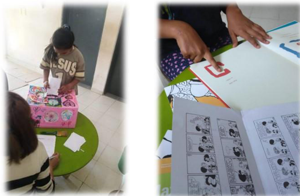
Actividades en el Espacio Sociopedagógico “Taller de la imaginación”