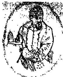
Julio A. Roca

Podemos decir entonces que las imágenes funcionan como un recurso didáctico importante y significativo, en cuanto acompaña el contenido siendo un soporte que estimula y refuerza el aprendizaje. Imponen la adquisición de un hábito perceptivo, forjada bajo el signo de una mirada que yuxtapone continuamente imágenes y texto. De esta forma coincidimos con Peter Burker (2005) cuando afirma que "las imágenes nos permiten imaginar el pasado de un modo más vivo" .