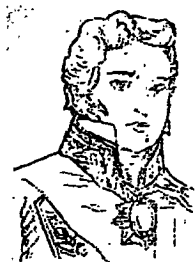
Juan Manuel de Rosas

"El General Roca combinando hábilmente el rigor con la política, ofrecía siempre a los indios la reducción en tierra de buen cultivo y pastoreo". (La conquista del desierto 1979:16)