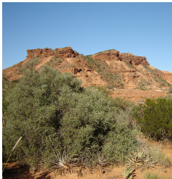
Fig. 1. Comunidad vegetal estudiada en el Parque Nacional Sierra de las Quijadas.

Las tres especies estudiadas son integrantes de la comunidad vegetal ubicada a 822 msnm y 32°29'56.3" Lat. S, 67° 0'34.3" Long. O. Las especies vegetales dominantes en esta comunidad son Aspidosperma quebracho-blanco , Bromelia urbaniana , Bulnesia retama , Larrea cuneifolia , L. divaricata , Prosopis flexuosa , Tillandsia sp, Zuccagnia punctata y algunas poáceas (Del Vitto et al. , 1994). En el sitio de muestreo en particular, formaron parte de la comunidad vegetal: Acacia furcatispina , Adesmia trijuga , Allenrolfea vaginata , Atriplex argentina , A. lampa , Baccharis latifolia , Cyclolepis genistoides , Deuterocohnia longipetala , Digitaria californica , Dyckia floribunda , Echinopsis leucantha , Gomphrena pulchella , Neobouteloua lophostachia , Opuntia sulphurea , Pappophorum caespitosum , Plectocarpa tetracantha , Schinus fasciculata , Setaria cordobensis , Sporobolus phleoides , S. pyramidatus , Tephrocactus articulatus , T. articulatus var. oligocanthus y Trichloris crinita (Fig. 1).