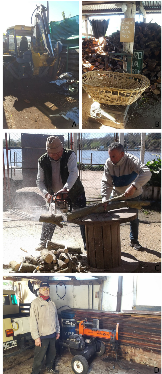
Fig. 3. Algunas herramientas utilizadas por los comerciantes. A: retroexcavadora; B: balanza; C: motosierra; D: hacha hidráulica.

En cuanto a la compra de leña, los entrevistados eligen especies de madera dura, consideradas “buenas” porque generan buena brasa y calor, y duran mucho, como Schinopsis balansae Engl., “quebracho colorado” y el “itín”. Las mismas provienen de diferentes provincias del norte del país, cortadas y listas para vender, o bien recortadas manualmente con hacha para usar como leña para salamandras. Según los entrevistados, para efectuar el transporte es necesario contar con una Guía de tránsito de productos forestales, que se tramita vía online en la página web del Ministerio de Agroindustria y tiene una validez de 72 horas. Para el caso de productos provenientes de bosques nativos se debe abonar una suma determinada por tonelada y se debe declarar la cantidad transportada, el importe y los datos personales.