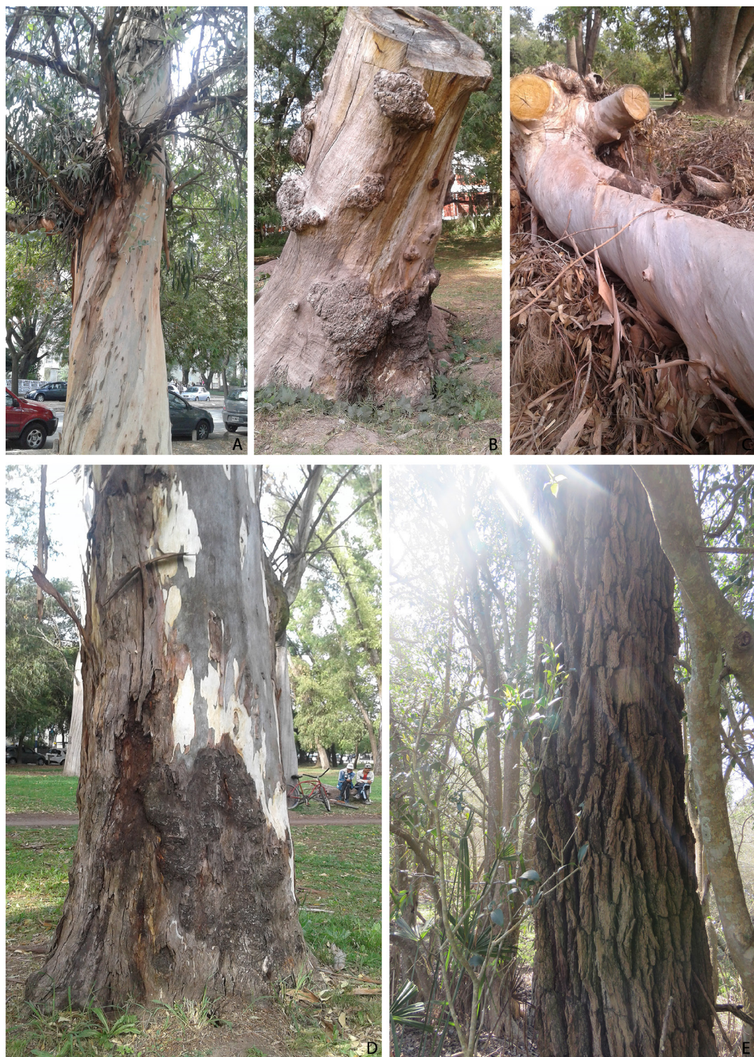
Fig 4. Etnoespecies y etnovariedades del género Eucalyptus . A: eucalipto blanco; B: eucalipto globulus, medicinal; C: eucalipto amarillo; D: eucalipto colorado; E: eucalipto medicinal.