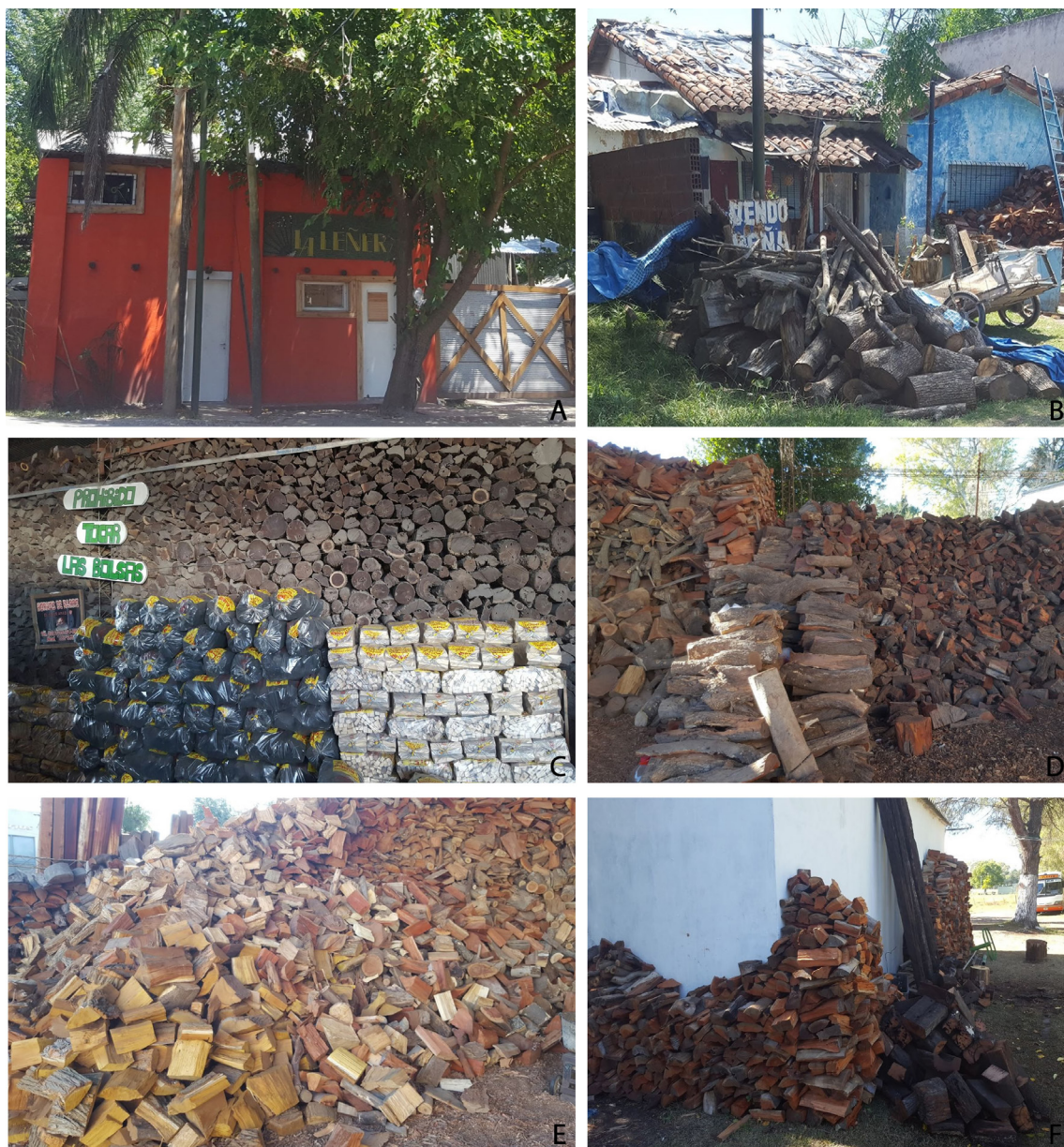
Fig. 2. Sitios de venta de leña. A: aspecto exterior de una leñera; B: casa particular de venta de leña a pequeña escala; C: pila de leña, carbón y bolsas “iniciadoras”; D: leña apilada por especie; de izquierda a derecha, eucalipto colorado, espinillo y quebracho colorado; E: mezcla de leña de distintas especies propias de la zona, F: pila de leña de eucalipto y quebracho y durmientes de quebracho aun sin cortar.

del humo que el hogar, por lo que también supone un ahorro de combustible); 3) de las dimensiones del ambiente a calefaccionar; si los usuarios sólo emplean leña o si suplementan la calefacción con