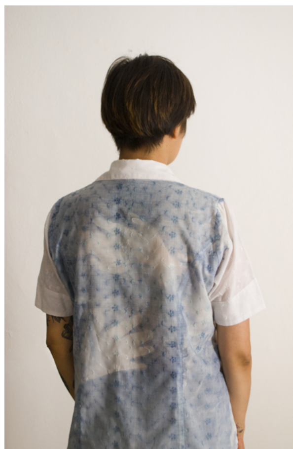
Imágenes 1-4: Kletzel, A. (2023). Sin título [performance] . Córdoba, Argentina.