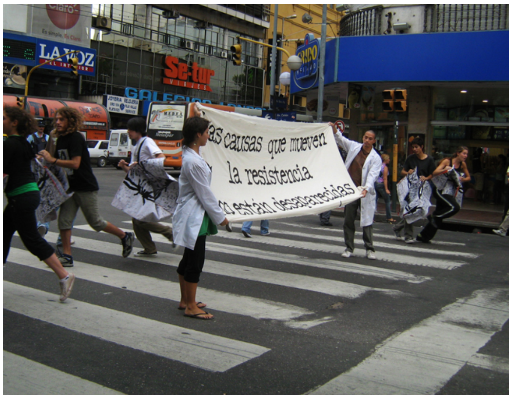
Imágenes 4 y 5: Insurgentes (2009). Aparecer, o el combate por la existencia . Córdoba, Argentina. Día 2.