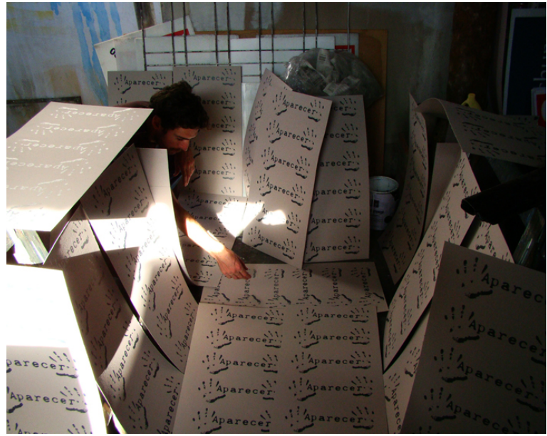
Imágenes 6 y 7: Insurgentes (2009). Aparecer, o el combate por la existencia . Córdoba, Argentina.

gerse frases como “Que los cuerpos que faltan aparezcan en los nuestros”, “Que la sangre derramada no sea en vano... Hasta el socialismo siempre!”.