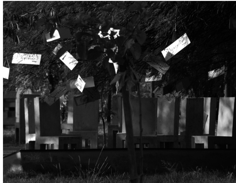
Imagen 10: Insurgentes (2009). Aparecer, o el combate por la existencia . Córdoba, Argentina. Día 4.

modulaciones, aquí presentamos cuatro: la pregunta por lo actual, la relación afectiva con el pasado, la cita, y la pregunta por el sujeto. Ha sido, como indicamos en la introducción, un ejercicio exploratorio de esa vinculación que admite otras derivas. Intentamos reponer una pregunta política antes que historiográfica, y entendemos que la noción de posmemoria lo habilita. Resuena en la propuesta de Hirsch aquella vieja preocupación de Benjamin (2005), atento a “salvar los fenómenos de una tradición que pretende hacerlo honrándolos como herencia (p. 475). La posmemoria, cree Hirsch, mira hacia atrás antes que hacia adelante. Como el ángel de la historia, aquella imagen que ofreció Benjamin en su novena tesis. Sabemos, esa mirada no admite vocación nostálgica. En los terrenos que nos ocupan, una política de los muertos y las muertas es también una política del presente.