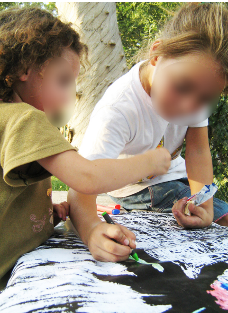
Imágenes 2 y 3: Insurgentes (2009). Aparecer, o el combate por la existencia . Córdoba, Argentina. Día 1.

Día 2. 23 de marzo: En la concurrida intersección de las Avenidas Colón y General Paz. Trasludamos la prensa de grabado, se hicieron copias de la matriz de alambre de púa (xilografía) junto a quienes transitaban a esa hora y se interesaron. Luego se hizo un cordón humano con las copias cuando el semáforo cortaba, poniendo al centro una bandera con las palabras de cierre de la Carta a la Junta Militar del escritor Rodolfo Walsh (1977): “Las causas que mueven la resistencia no están desaparecidas”. 14