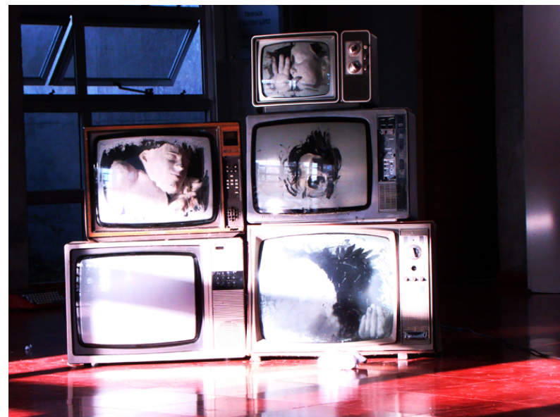
Imágenes 8 y 9: Insurgentes (2009). Aparecer, o el combate por la existencia . Córdoba, Argentina. Día 4.